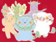
展覧会をナビゲートする奈良国立博物館公式キャラクターの「ざんまいす」

【会場】 奈良国立博物館 東新館・西新館 【観覧料】 一般700円、大学生350円 ※この観覧料で名品展が観覧可能 【お問い合わせ】 ハローダイヤル TEL:050-5542-8600