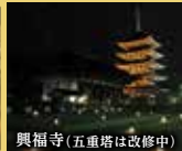
興福寺(五重塔は改修中)