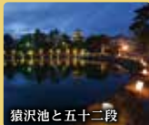
猿沢池と五十二段