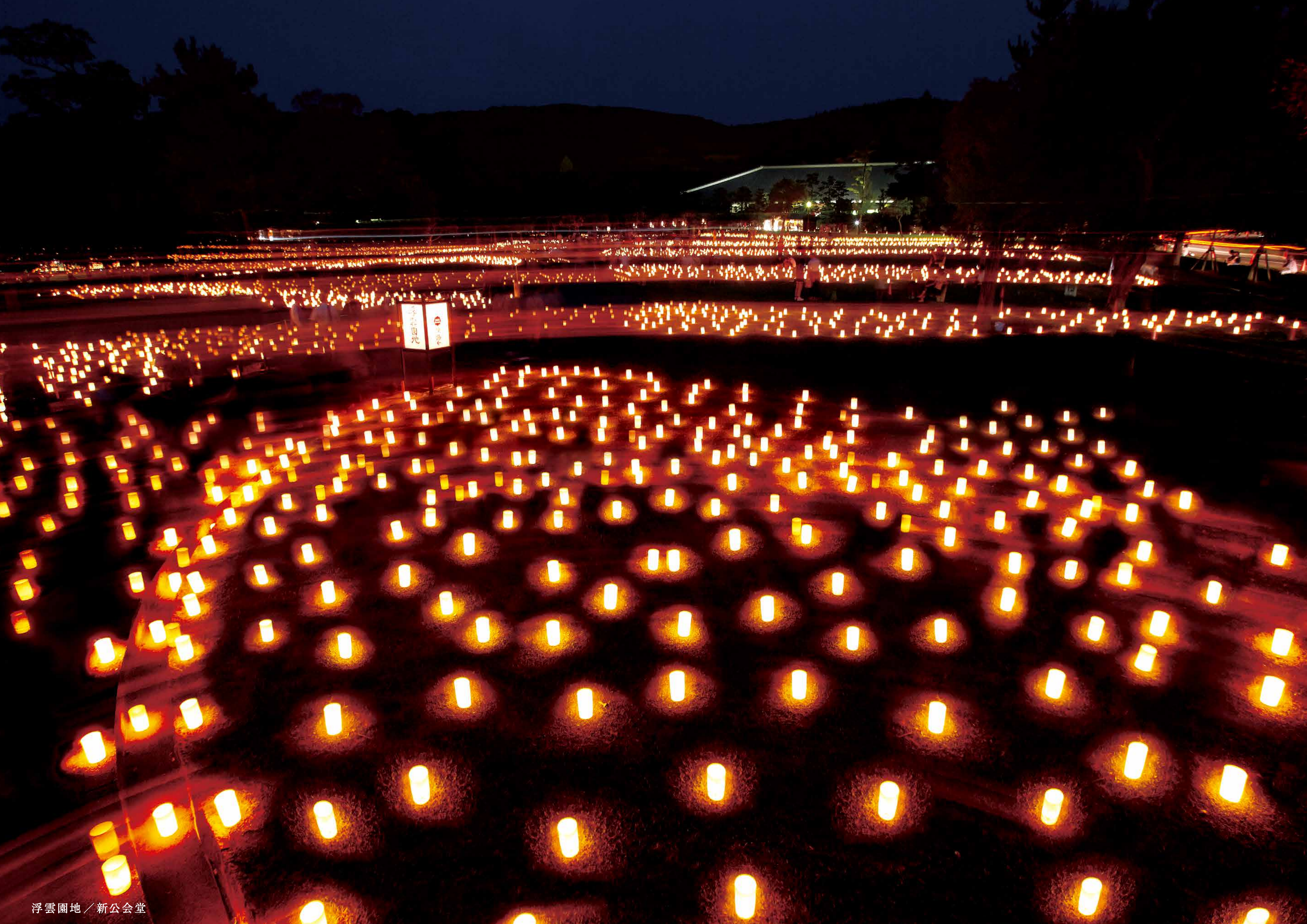
浮雲園地 / 新公会堂