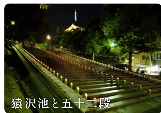
猿沢池と五十二段